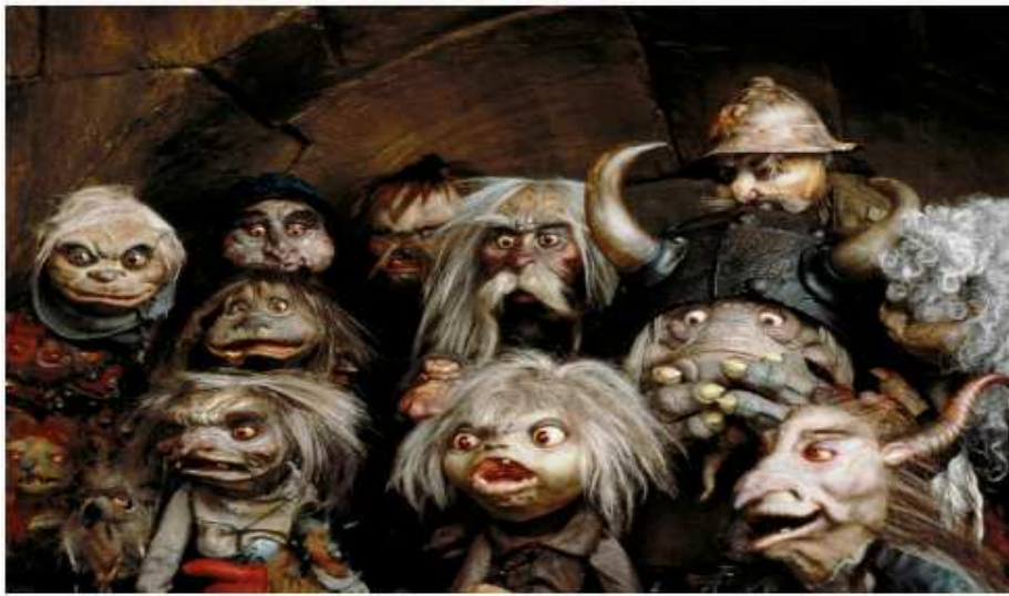
EN LA FOTO, UN GRUPO DE GUALTRAPAS DESBORDADOS POR LA DURA COMPETENCIA ...

¡Lamentable! Pero es ley de vida: Solo los fuertes prevalecen. Habrá que recurrir a la clonación genética en plan "Jurassic Park" si queremos ver de nuevo a estas "peñitas" corretear libres por los bares de Bustar.