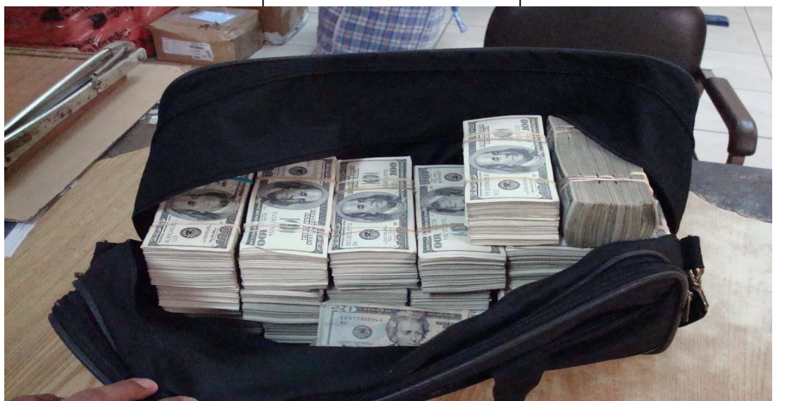
¿UNA PEÑA SIN ÁNIMO DE LUCRO? ¿"BAILLARINES" O "URDANGARINES"???

(NOTA Informativa: El redactor de esta gaceta bebe Brugal con CocaCola, gracias).