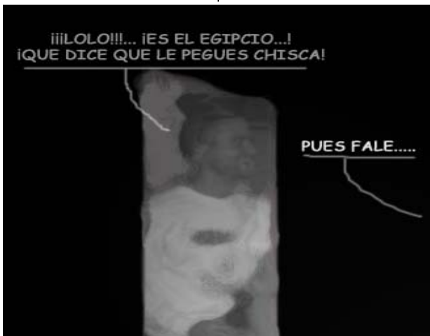
MUCHOS MISTERIOS RODEAN AL TREMENDO INCENDIO DEL WINDSOR (IMAGEN TELEOBJETIVO DEL WINDSOR)