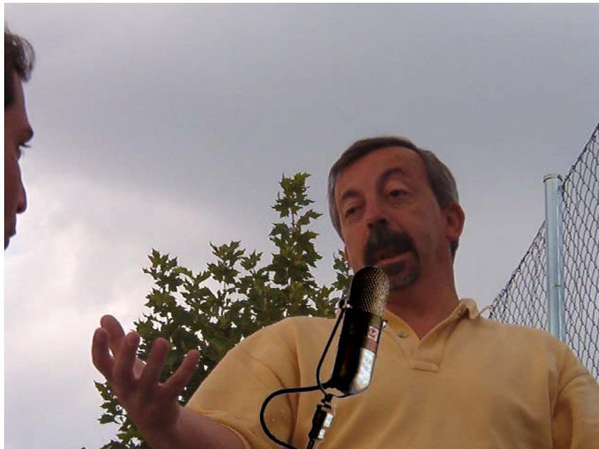
MUY AMABLEMENTE, UNO DE LOS MIEMBROS MÁS DESTACADOS DE LA PEÑA OVEJAS NO, GRACIAS NOS CONCEDIÓ UNA ENTREVISTA PARA HABLAR DEL SEGUNDO VOLUMEN EDITADO DE LA SAGA "IN ANIMUS IOCANDI".

-Entrevistador: "Gracias por concedernos esta entrevista."