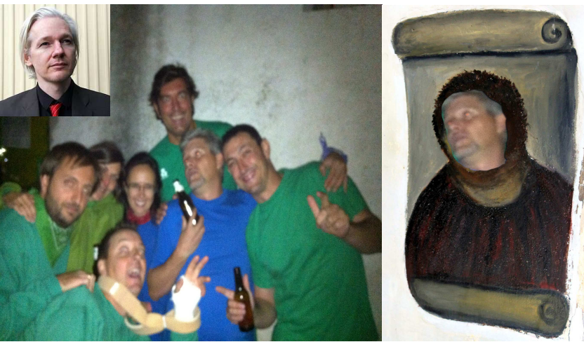
LA PATRULLA ABUTARDA CAPTURA A LOS ÚLTIMOS FUGITIVOS COCIDOS.

JULIAN ASSANGE NOS DESVELA EN UNA ENTREVISTA EXCLUSIVA LOS SECRETOS MÁS ESCABROSOS DE LOS COCIDOS MADRILEÑOS