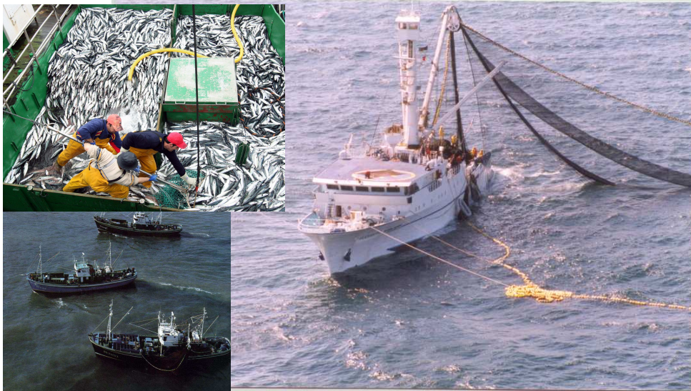
LOS PESQUEROS ABUTARDOS TRABAJAN A DESTAJO PARA INTENTAR CONSEGUIR ESTE AÑO TODAS LAS SARDINAS DEMANDADAS. SU ESFUERZO NO SERÁ EN VANO.

"A Díos pongo por testigo de que jamás pasará hambre el Sábado de fiestas, gracias a los Abutardos y sus fantásticas Sardinas..." comen-