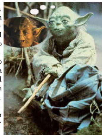
Los Gualtrapas recuerdan con horror la última edición jugada.

En cualquier caso, tanto a los Gualtrapas como al resto de peñas, los Abutardos os desean FELICES FIESTAS!!!