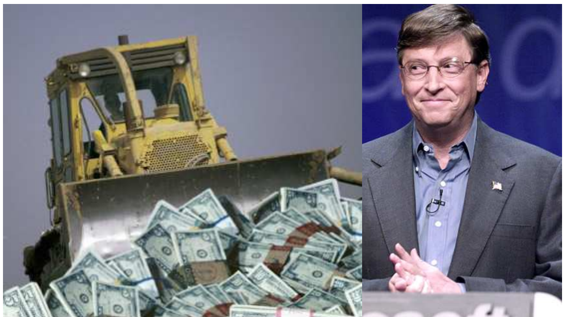
BILL GATES (EX-WANAMINO) EMPEZÓ ASÍ: AHORA ES RICO, PERO SUMAMENTE IMPOPULAR