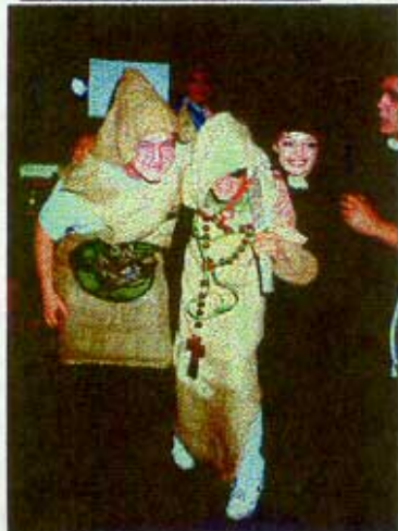
TRES GUALTRAPAS EN EL DÍA DE SU PRIMERA COMUNIÓN (IMAGEN DE ARCHIVO)