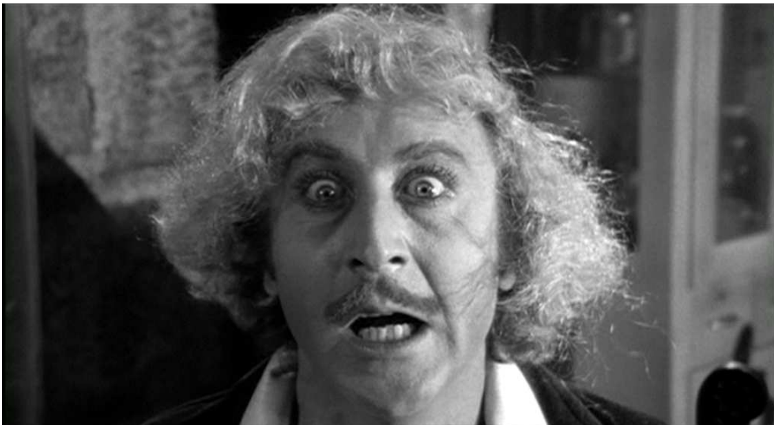
EL PROFETA, ATÓNITO, NO PUEDE DAR CRÉDITO... ¿VISIÓN FUTURISTA O DIGESTIÓN PESADA? DIFÍCIL DE CREER EN CUALQUIER CASO...

Fue como estar en el capítulo final de Los Serrano , como el final de Perdidos ... Definitivamente: Creo que no vuelvo a probar el queso azul."