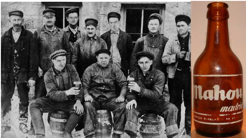
UNA DELEGACIÓN DE INSIGNES OVEJAS INAUGURANDO UNA FÁBRICA DE CERVEZA A PRINCIPIOS DE SIGLO XX, Y UN BOTIJO DE FINALES DEL MISMO...

(*N.d.R: Bebida refrescante de los 70, barata y de elaboración casera)