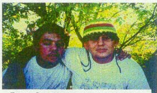
EL CLAN GUALTRAPA, INCAPAZ DE SOPORTAR LA PRESIÓN DE ESTOS DÍAS

¡Se acerca la hora de la victoria! ¡Ha llegado el momento de recuperar el título! Sin duda, este año los Abutardos derrotarán a los Gualtra-