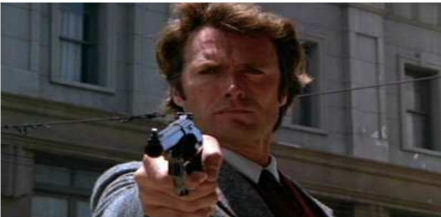
HARRY EL SUCIO TAMPOCO DEJABA PASAR NI UNA...!

A: Pero bueno!... Te creías que te ibas a escapar ¿eh? ¡Te hemos pillado! ¡Ese ambientador de pino no está homologado!! POR FAVOR SALGA DEL COCHE CON LAS MANOS EN ALTO.....!!!! Fadrique!, pide refuerzos....!!!!