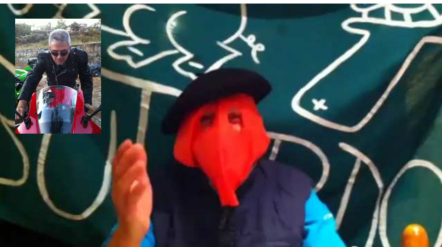
IDENTIFICADO EL CABECILLA DEL TEMIBLE COMANDO COCIDO

LAS FUERZAS DIPLOMÁTICAS Y DE SEGURIDAD ABUTARDAS RECUPERAN LA INSIGNIA VERDE JUSTO A TIEMPO.