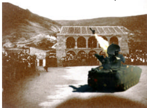
Este año el alcalde garantiza que la traca será más "sonada" e "interactiva" que el año pasado...