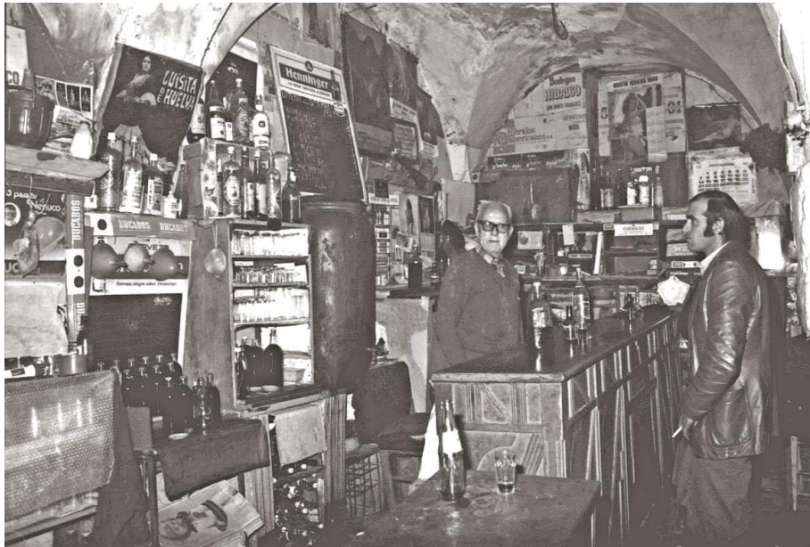
IMAGEN DE ARCHIVO DEL PUB YETIS, DONDE VEMOS DOS OVEJAS EN PLENO JUERGOTE. LA MARCHA BUSTAREÑA YA APUNTABA MANERAS...

Y precisamente, el hastío y la poca marcha es lo que ha llevado al magnate