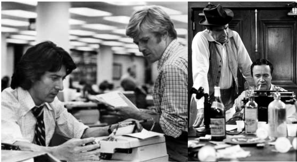
A LA IZQUIERDA, LOS DOS JÓVENES ABUTARDOS AL FILO DE LA NOTICIA EN EL 96. A LA DERECHA, 20 AÑOS MÁS TARDE, TODO SIGUE MÁS O MENOS IGUAL... COMO EN LA PELÍCULA DE WILDER, ALGUNO SE RESISTE A ABANDONAR LA REDACCIÓN.

Hay que mencionar que estos últimos como los ovejas y otros, pero en especial ellos, han sabido enca-