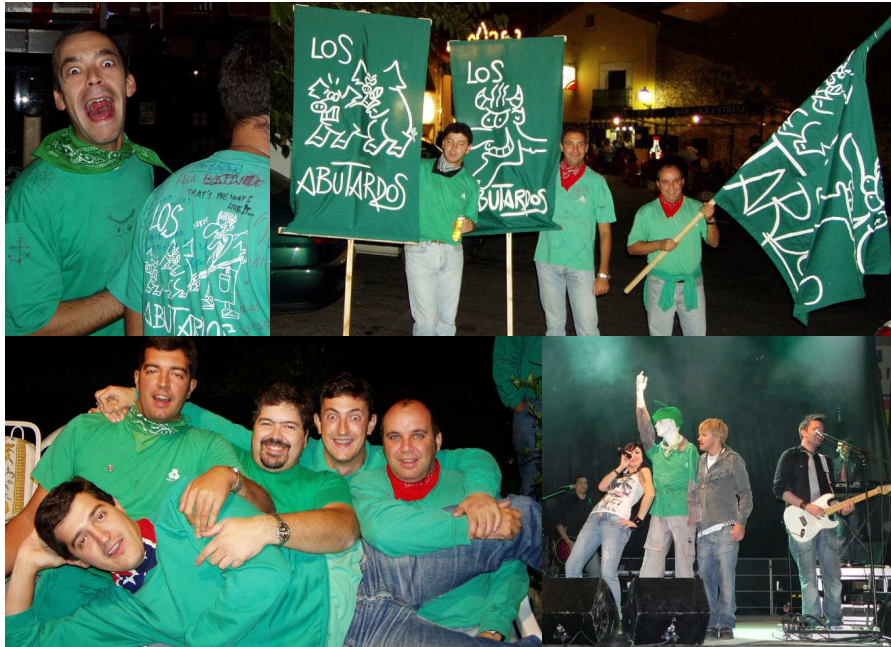
GRANDES MOMENTOS HEMOS PASADO... ¡Y LOS QUE NOS ESPERAN!

La segunda clave: unas cuentas saneadas... Por todos es sabido lo difícil que es recaudar la cuota impositiva participación voluntaria de una peña (en aquellas peñas que haya tal organización), y también que la disciplina en el pago no es algo que abunde. No obstante, una sólida organización y un férreo e insistente cercano y convincente departamento de "asuntos inter-