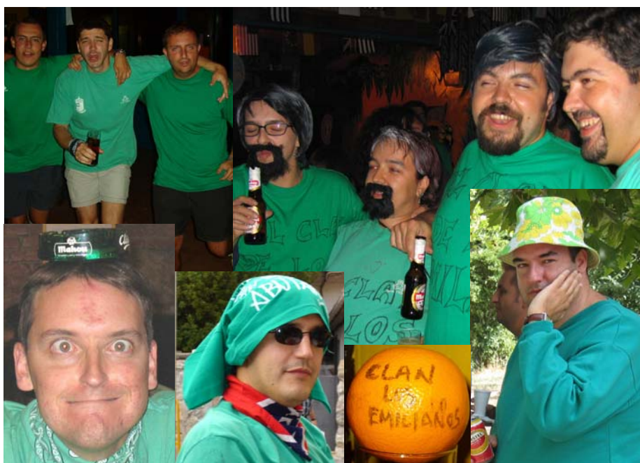
TRAS UN AÑO CARGADO DE EXCESOS, LOS ABUTARDOS SE RECUPERAN DE LOS DUROS GOLPES DEL DESTINO...

No obstante, los verdes llevan unos años en la grata tarea de crear cantera. De esta forma seguiremos siendo la peña más numerosa, además de tener representación en la liga juvenil, alevín y senior. Tampoco debemos olvidar los nuevos Abutardos (y sobre todo guapísimas Abutardas) que han entrado a formar parte